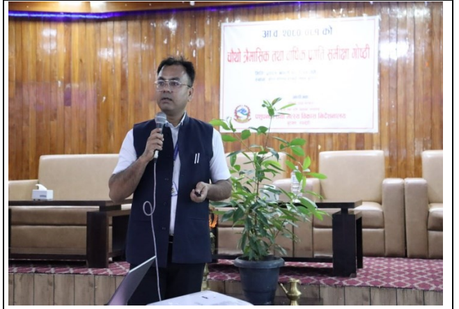
कार्यक्रममा सहभागीहरु तथा भए गरेका केही कृयाकलापहरु